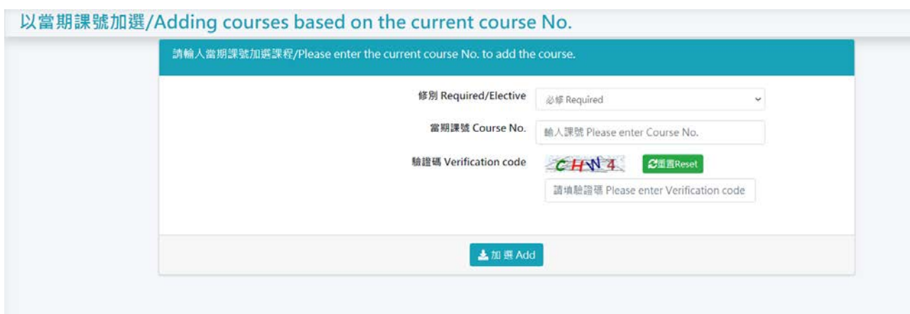
圖 18-以當期課號加選

若同學已查好當期課號(4 碼)，可直接使用此功能進行快速選課，若欲更改修別，請於修別下拉，之後輸入課號及驗證碼，將於下方出現選課結果，如圖 18。