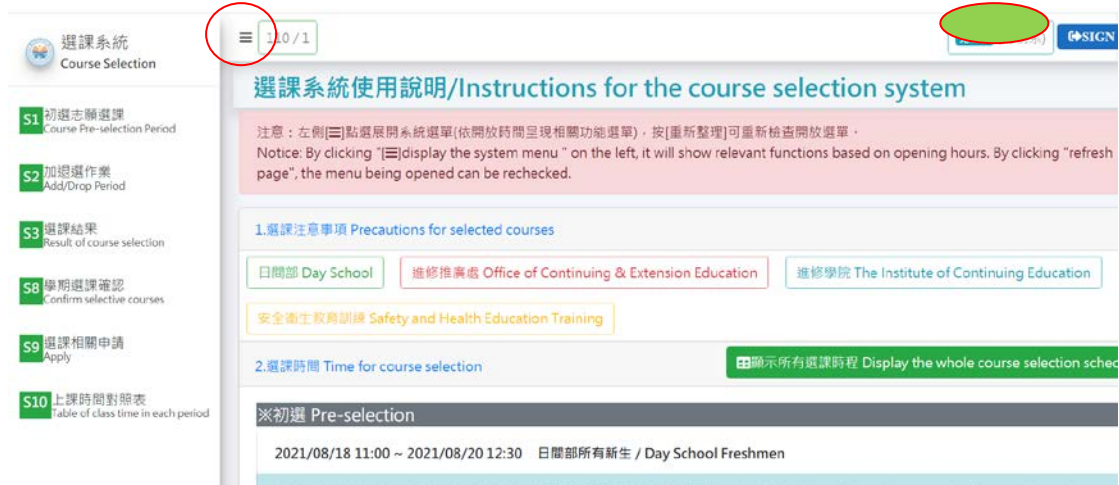
圖 2-選課系統使用說明

選課時間未開放時登入系統，圖 2 左方功能表無呈現選課項目，選課時間開放時間登入系統後左側功能表會出顯選課相關功能項。